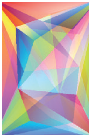
ARTE CINETICA / NEW MEDIA