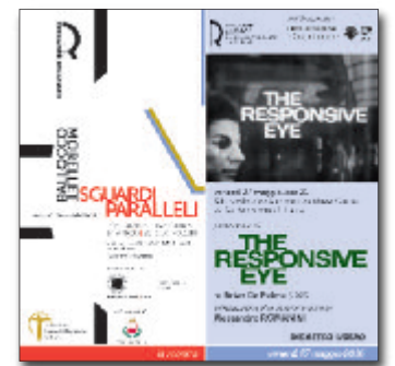
27 maggio 2016 SGUARDI PARALLELI. INIZIATIVE COLLATERALI proiezione di The Responsive Eye di Brian De Palma introduzione alla visione a cura di Alessandro Romanini