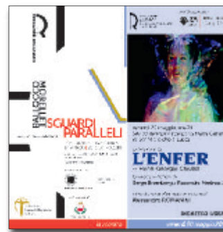
20 maggio 2016 SGUARDI PARALLELI. INIZIATIVE COLLATERALI proiezione di L'enfer di Henri-Georges Clouzot. Una docu-fiction di Serge Bromberg e Ruxandra Medrea introduzione alla visione a cura di Alessandro Romanini