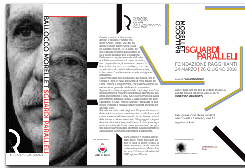
24 marzo – 26 giugno 2016 Sguardi paralleli. Ballocco / Morellet mostra a cura di Paolo Bolpagni