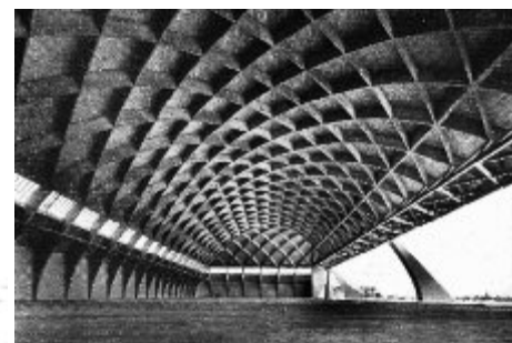
GIOLLI / RAGGHIANTI / CASABELLA