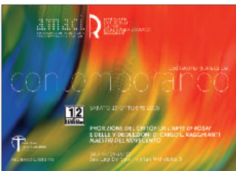
15 ottobre 2016 Dodicesima giornata del contemporaneo proiezione del critofilm L'arte di Rosai e delle videolezioni di Carlo L. Ragghianti Maestri del Novecento