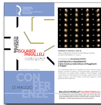
13 maggio 2015 SGUARDI PARALLELI. INIZIATIVE COLLATERALI Continuità o modernità? L'Arte Cinetica nelle letture di Ragghianti e Popper conferenza di Annamaria Ducci