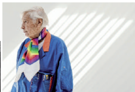
JULIO LE PARC