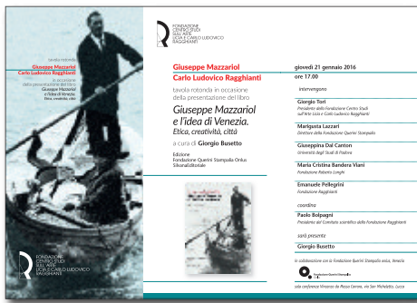
21 gennaio 2016 Tavola rotonda in collaborazione con la Fondazione Querini Stampalia di Venezia, in occasione della presentazione del libro a cura di Giorgio Busetto Giuseppe Mazzariol e l'idea di Venezia. Etica, creatività, città Fondazione Querini Stampalia-Silvana Editoriale, Venezia-Milano 2014