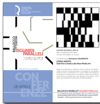
28 aprile 2016 SGUARDI PARALLELI. INIZIATIVE COLLATERALI Opera aperta. Dall'Arte Cinetica alla New Media Art conferenza di Domenico Quaranta