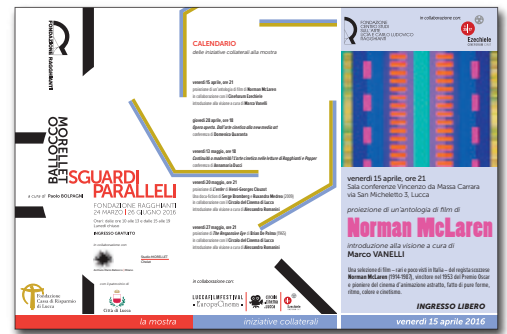
15 aprile 2016 SGUARDI PARALLELI. INIZIATIVE COLLATERALI proiezione di un'antologia di film di Norman McLaren introduzione alla visione a cura di Marco Vanelli