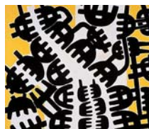
Esplosione di forma e colore

L'informale europeo e la situazione italiana con Fontana, Burri e Capogrossi. La contrapposizione politico-teorica tra il gruppo Forma 1 e il fronte del realismo di Guttuso.