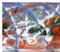
Dalla casa al museo