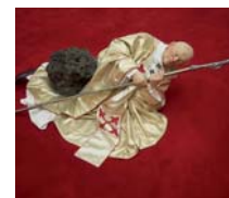
Poveri. Concettuali. E provocatori.

I movimenti artistici dell'Arte Povera e dell'Arte Concettuale degli anni Settanta, con un'incursione nelle forme di provocazioni del XXI secolo (Cattelan, Hirst...) pure ascrivibili alla tendenza concettuale.