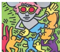
I nuovi 'comportamenti' dell'arte

Pop Art, New Dada, Nouveau Réalisme e gli happenings , da Fluxus fino ai nostri giorni.